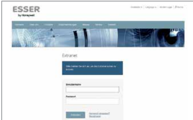
1. Kundenlogin ESSER